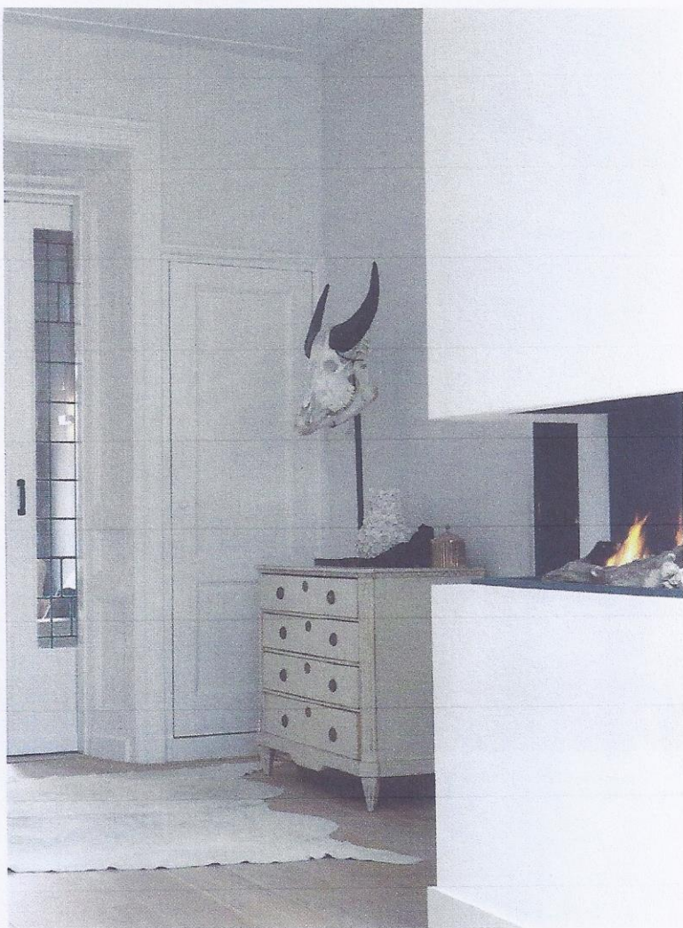
Foto rechts: Anouk liet een extra haard bouwen die als scheidingwand dient. Op de achtergrond een brocante kastje met een skelet van een koeienkop.

verre landen in de schijnwerpers. Het interieur heeft een strak gestuukte openhaard en wollige bontjes die het huis warmte geven. De ruime zitbank aan de eettafel is klassiek gecapitonneerd, maar wel gecombineerd met designstoelen van Moooi. Het geeft het huis karakter, klasse en pit.